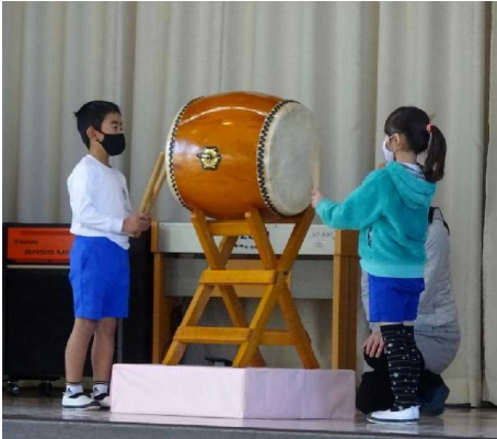
【↑クリスマスステージ「おまつりの音楽」(2年生)】