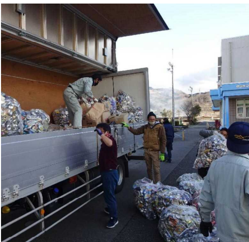
【↑ 第2回資源回収(12/19・土)】

12月19日(土)に、第2回資源回収を行いました。新型コロナウイルス感染予防のため、作業は教職員とPTA役員様だけに限定し、ドライブスルー方式での回収とさせていただきました。