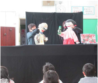
【↑ 人形劇「わさびなるほどものがたり」】

コロナ禍とはいえ第3派が少しずつ和らぐ中、中伊豆小学校では“地域を学ぶ活動”“地域で学ぶ活動”を活発に行っています。