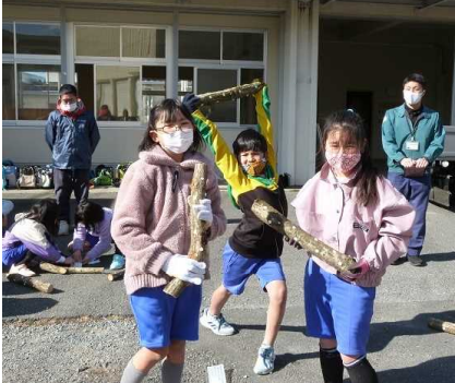
【↑ しいたけ植菌体験で喜ぶ児童】