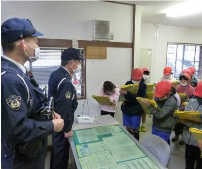
【↑ 中伊豆交番を見学する3年生】