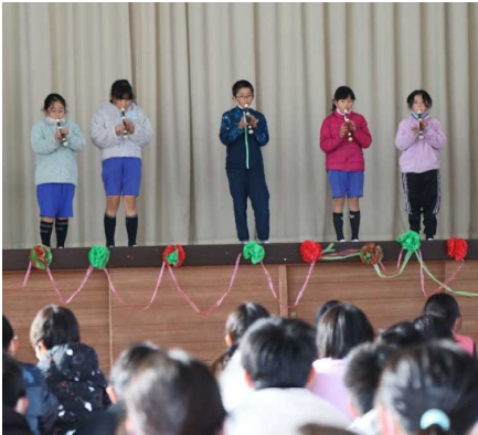
【 ↑ クリスマスステージの様子 】