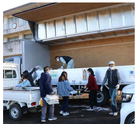
【 ↑ 旧大東小学校での資源回収 】

なお今回の収益金額につきましては、業者からの連絡が間に合わなかったため、次号にてお知らせいたします。