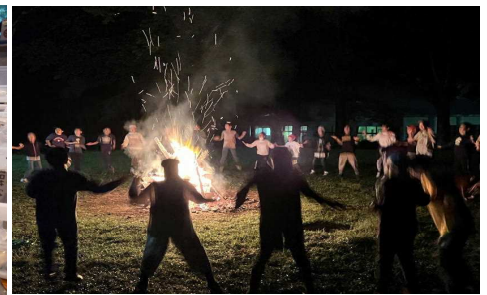
【キャンプファイヤー】