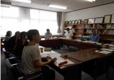
【学校運営協議会の様子】

先日は平日の午前中にもかかわらず、多くの方に授業参観にご来校いただきましてありがとうございました。子どもたちは保護者の方に自分の活躍を見てもらおうと、朝から張り切っていました。授業での頑張りをご家庭でも話題にさせていただけたかと思います。