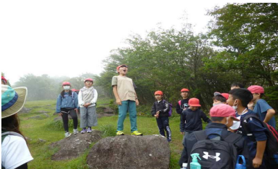
【ハイキング～金冠山～】

自然教室を成功させるために、スローガン「みんなといっしょに協力し合って楽しい自然教室にしよう」を掲げ、仲間と協力し合って生活しました。大きく成長した、思い出に残る2日間でした。