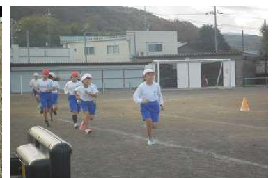
持久走チャレンジ