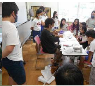
押し花アートクラブ