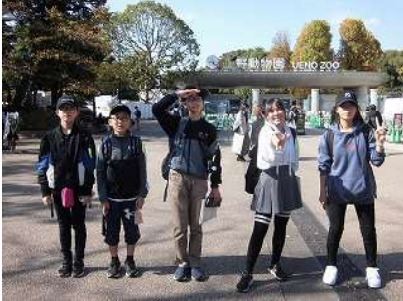
班別学習(上野にて)