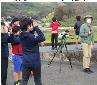
実験・自然観察クラブ