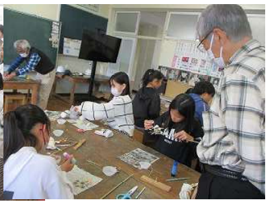
竹細工・工作クラブ