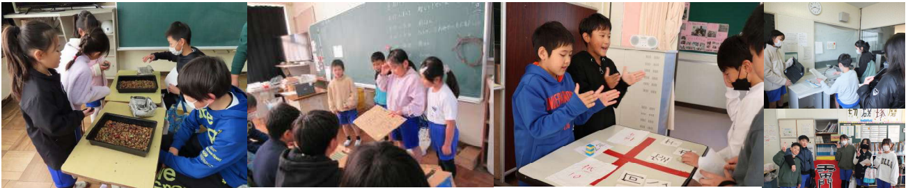
あきのスペシャルランド みんなであそぼうせぜんランド 楽しく学べる国語広場

12月11日(水)、企画委員会主催の「中小フェス」が開催されました。どの学年もお店を開き、国語、算数、社会、図工、生活・総合……など、自分たちが授業で学習した内容を伝えました。ゲームやクイズ、体験など、アイデア満載のコーナーを考え、全校のみんなに楽しんでもらうことができました。2階のお店を回ろうとしていた1年生。初めての中小フェスで、どこに行ったらよいのか困っている様子でした。そこに3年生が登場。優しく声を掛け案内していた姿がとても微笑ましかったです。中伊豆小の子どもたちの表現力、相手を思いやる力が、行事を通して伸びています。参観してくださった保護者の皆様、お時間を作っていただきありがとうございました。