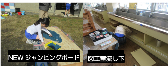
NEW ジャンピングボード

6年間お世話になった学校に感謝の気持ちを込めて、6年生が自分たちで奉仕作業を企画し、学校中をきれいにしてくれました。普段手の届かない高い場所や、ジャンピングボードのペンキ塗りなど、一生懸命作業してくれました。